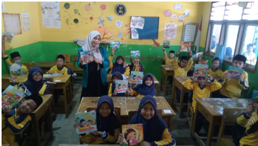
Gambar 4. antusiasme siswa-siswi dalam kegiatan sosialisai literasi