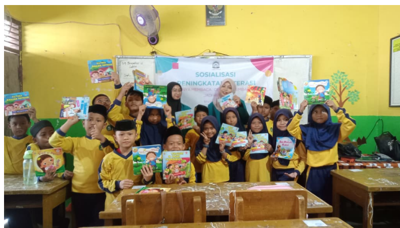
Gambar 3. Dokumentasi Foto bersama.