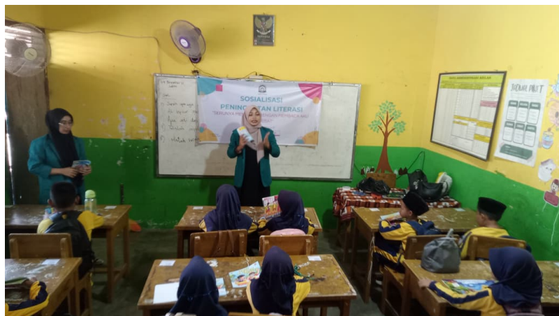
Gambar 2. Kegiatan Sosialisasi.

Secara keseluruhan, kegiatan sosialisasi ini memberikan dampak multidimensional: meningkatkan kesadaran literasi, menumbuhkan motivasi membaca, menambah pengalaman interaktif siswa dengan buku, serta memperkuat peran sekolah dalam mendukung gerakan literasi. Temuan ini sesuai dengan beberapa penelitian sebelumnya yang menunjukkan bahwa pendekatan langsung dan interaktif merupakan strategi paling efektif untuk meningkatkan minat baca anak usia sekolah.